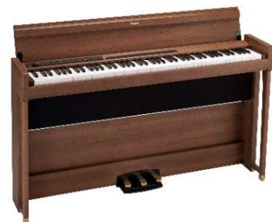
協力：株式会社コルグ

～セミナー内容～ プレイエルとイタリアンピアノ2つの音色が入ってピッチ(音程)が変えられる 電子ピアノKORG『Poetry ポエトリー』を使用して、生ピアノと電子ピアノの違いを解説。また、“シヨパンやピティナ・ピアノコンペティション”課題曲を採り上げ、演奏・解説いたします！