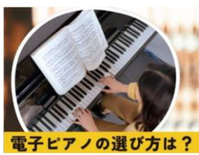
電子ピアノの選び方は？