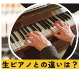
生ピアノとの違いは？