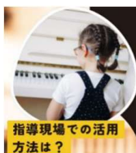
指導現場での活用方法は？

桐朋女子高校音楽科、イモラ国際ピアノアカデミー（伊）、パリ・エコールノルマル音楽院コンサートコースをそれぞれ卒業。浜松国際ピアノアカデミーコンクール、フンメル国際ピアノコンクール他入賞多数。スロヴァキアフィルハーモニー管弦楽団などオーケストラ共演多数。国内外での活躍ぶり、特にプロコフィエフの演奏がラジオ、音楽専門誌、新聞など各メディアで高く評価されている。5枚のCDをリリース、音楽専門誌で高い評価を得る。全音楽譜出版社より3冊の楽譜を編著。ピティナ・ピアノコンペティション特別指導者賞、シヨパン国際ピアノコンクール in ASIA 指導者賞を受賞。昭和音楽大学専任講師。