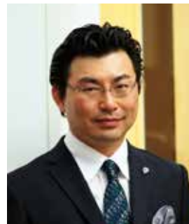
あかまつ りんたろう 赤松 林太郎

1990年全国学生音楽コンクール第1位、2000年クララ・シュー マン国際ピアノコンクール第3位など多数受賞。神戸大学を卒業後、 パリ・エコール・ノルマル音楽院にてピアノ・室内楽共に高等演奏 家課程ディプロムを審査員満場一致で取得。国内各地の主要ホー ルはもとより、アメリカ、ロシア、ドイツ、フランス、イタリア、ス ペイン、オーストリア、ハンガリー、台湾、コロンビアなどを公演 で回る。近年では2013年よりウィーン各地で室内楽コンサートを 開始、2013年秋にデュッセルドルフにてリサイタル、2014年春に 生前のバルトークが使用したピアノ (ハンガリー科学アカデミー所 蔵) でリサイタル、また2015年春はドナウ宮殿におけるドナウ交 響楽団との共演を成功させ、夏はミラノでソロリサイタル、秋はブ ダペスト、ウィーンにて公演。2017年春は再びドナウ交響楽団と 共演。キング・インターナショナルから《ふたりのドメニコ》(レ コード芸術準特選盤)、《ピアソラの天使》、《そして鐘は鳴る》 (準特選盤) をリリースして各誌で絶賛される。初の著書《赤松林 太郎 虹のように》を道徳書院より発刊。1,000名以上の指導に携 わり、多くの受賞者を輩出している (ピティナ特級グランプリ・銀 賞・銅賞、東京音楽コンクール優勝他)。各地で開催される講座で も好評をおさめ、エッセイストとしては新聞や雑誌にも連載を持っ ている。第1回よりダスミア・タレント国際音楽コンクール (ハンガ リー) の審査員長を務める。一般社団法人日本ピアノ指導者協会 評議員、演奏研究委員。ブダペスト国際ピアノマスタークラス講師、 洗足学園音楽大学客員教授。 http://rintaro.jp